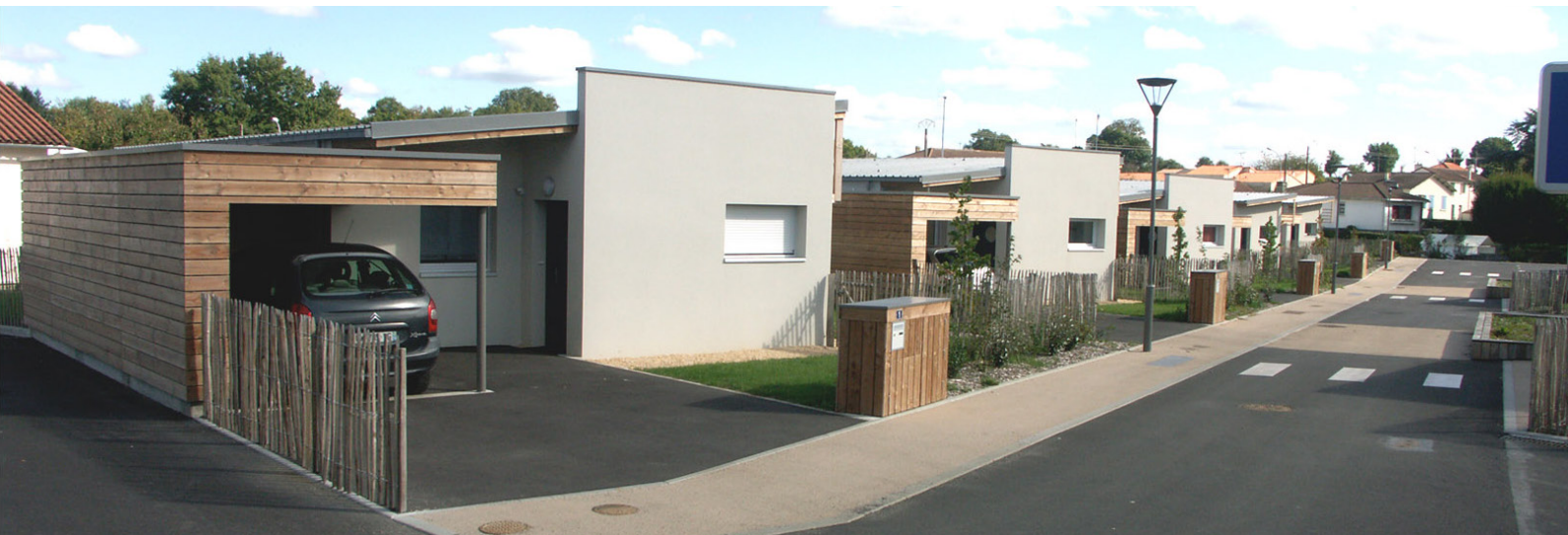
Rue des Couturières