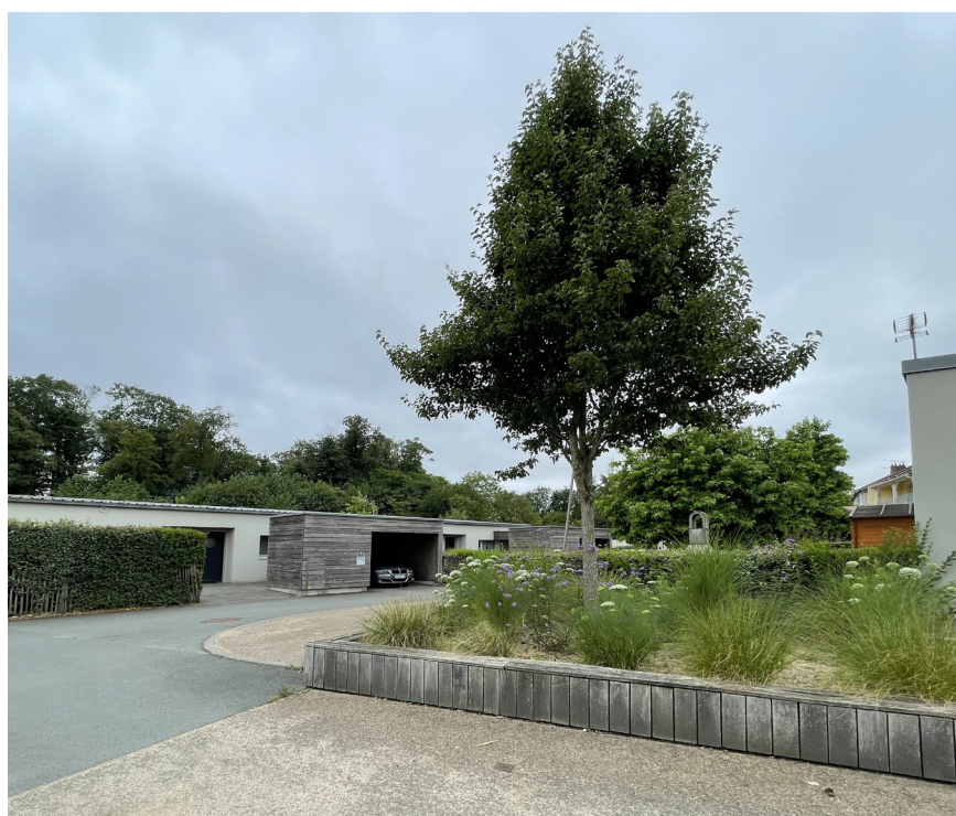
Aménagement des espaces publics en régie