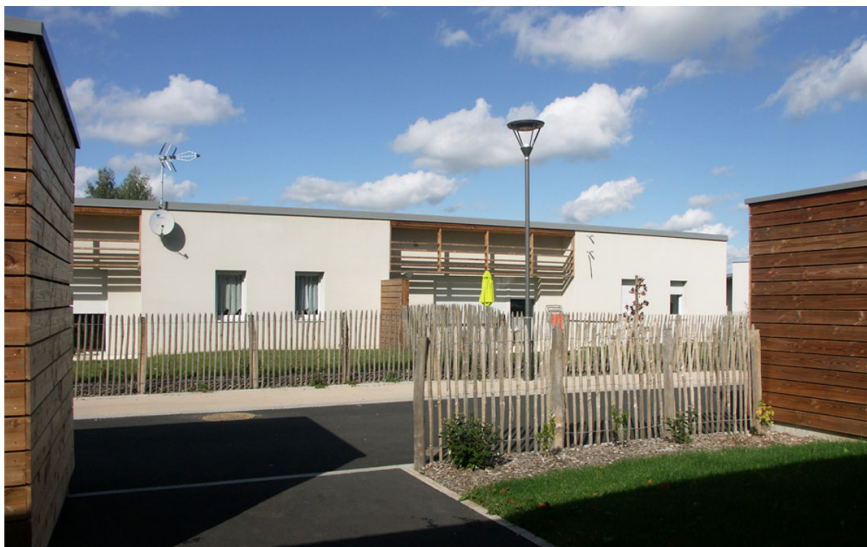
Logements accolés © Jean Merlet