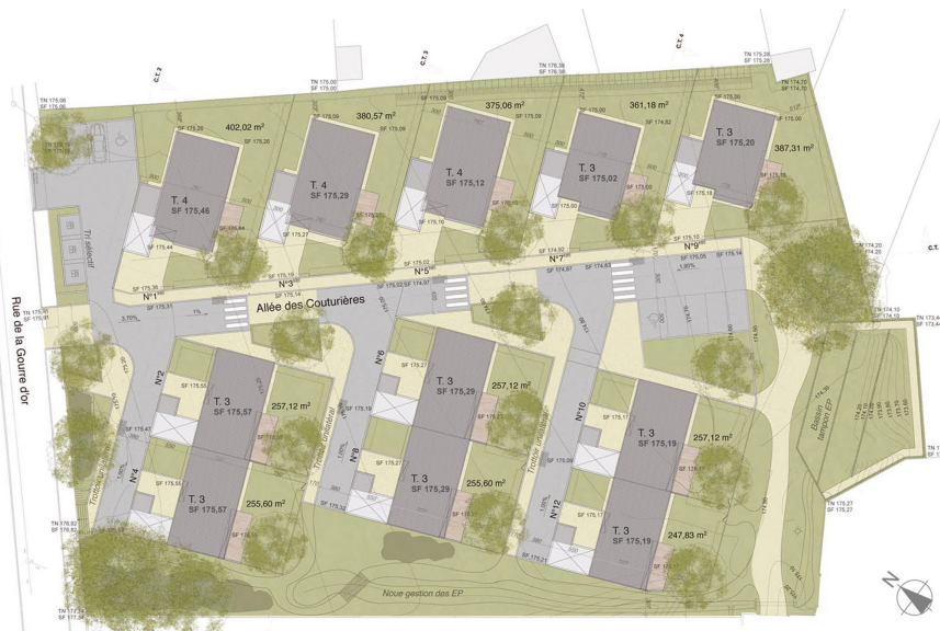
Illustration des principes d'aménagements en plan masse © Jean Merlet