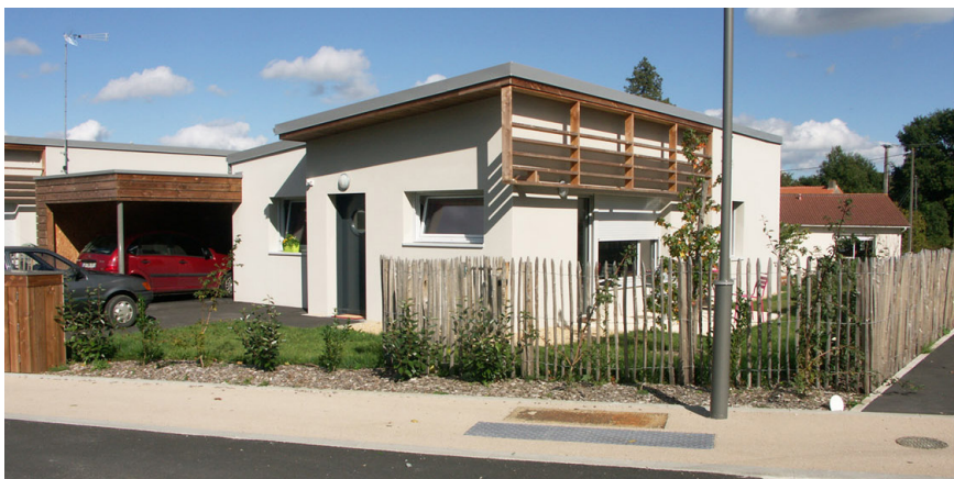
Logements isolés © Jean Merlet